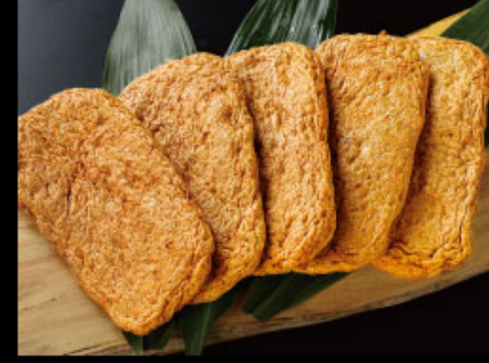
軽くてさらさら美味! 宇和島 安岡蒲鉾 ●愛媛県 宇和島じゃこ天(5枚) 1,026円