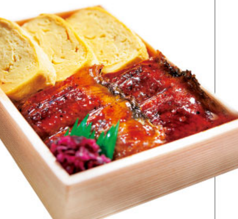
心やすらぐ京の味。 大徳寺さいき家 ●京都府 鰻だし巻弁当(1折)……1,944円