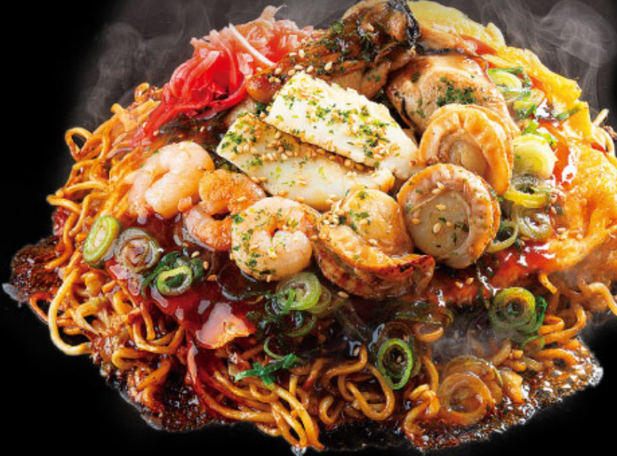
広島のお好み焼きはここから始まった! 牡蠣海鮮焼き みっちゃん横川店分家 ●広島県 牡蠣海鮮デラックス焼(1枚)……1,620円