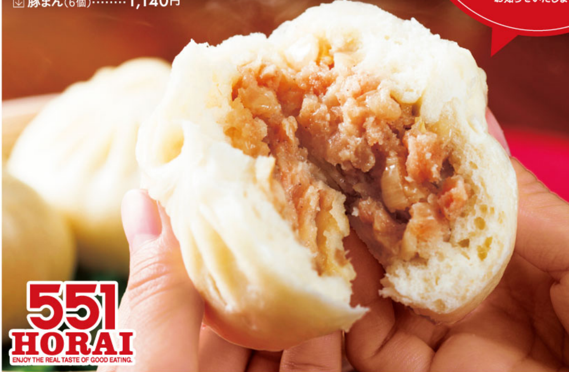
551 HORAI ENJOY THE REAL TASTE OF GOOD EATING

551 HORAI 待ち時間がわかる整理券配布 店頭でご購入ご案内整理券を発行いたします。スマートフォンをお持ちのお客様は二次元コードを読み取りいただきましたら待ち時間をリアルタイムでお知らせいたします。スマートフォンをお持ちでないお客様にも整理券発行時におおよその待ち時間をお知らせいたします。