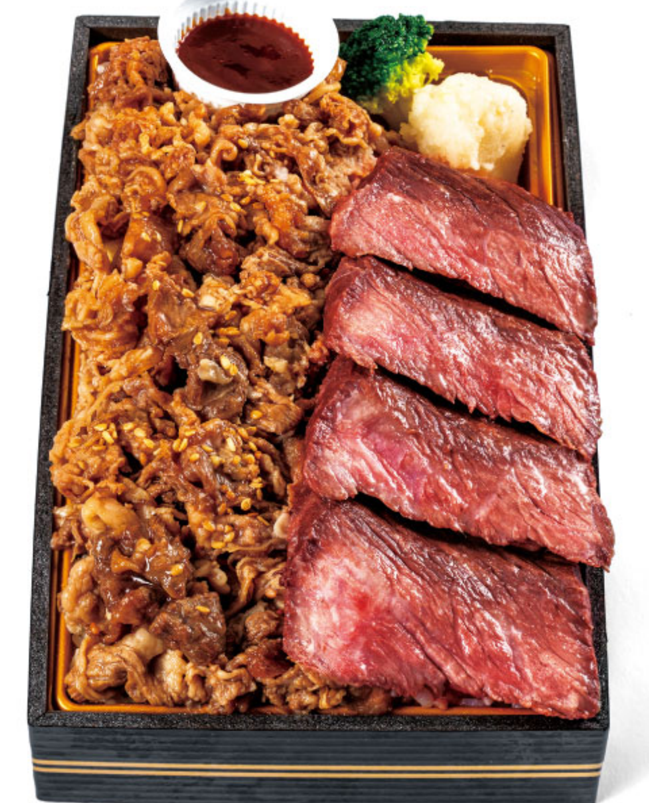
柔らかで芳醇な味わい 松阪牛×近江牛の贅沢な組み合わせ。 ブランド牛弁当 南洋軒 ●滋賀県 松阪牛ステーキ&近江牛焼肉弁当(1折)……1,800円