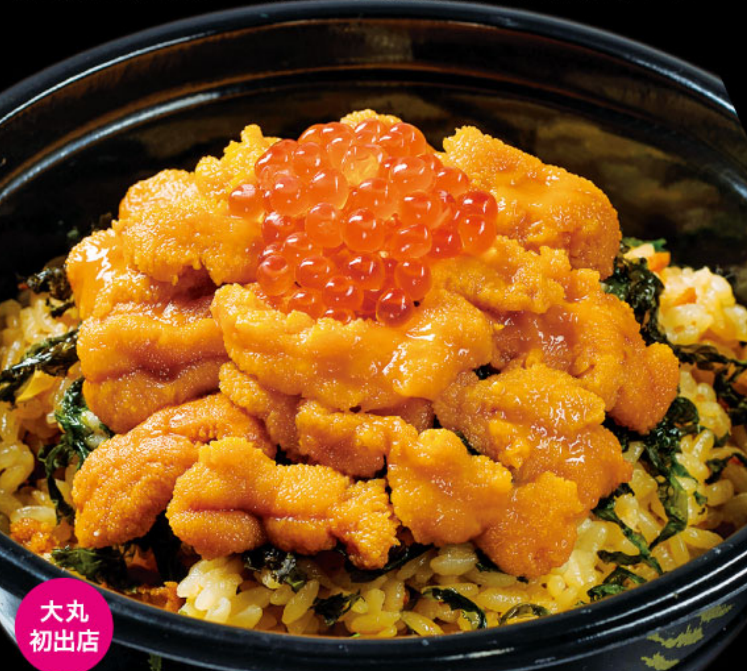
大丸初出店 うの旨みを味わう一杯! 豪快うに丼 寿司・割烹おおむろ ●大分県 うにつくし丼(1折)……1,836円