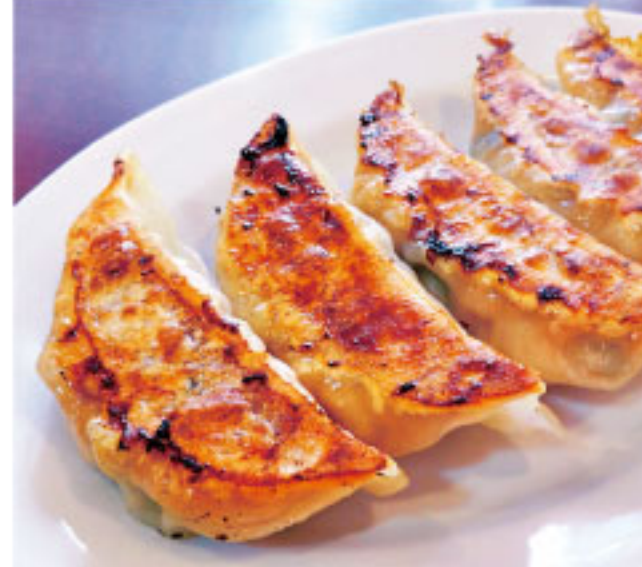
肉の旨味にこだわったジューシーな餃子! 宇都宮餃子悟空 ●栃木県 特製肉餃子(8個入り) 1,080円