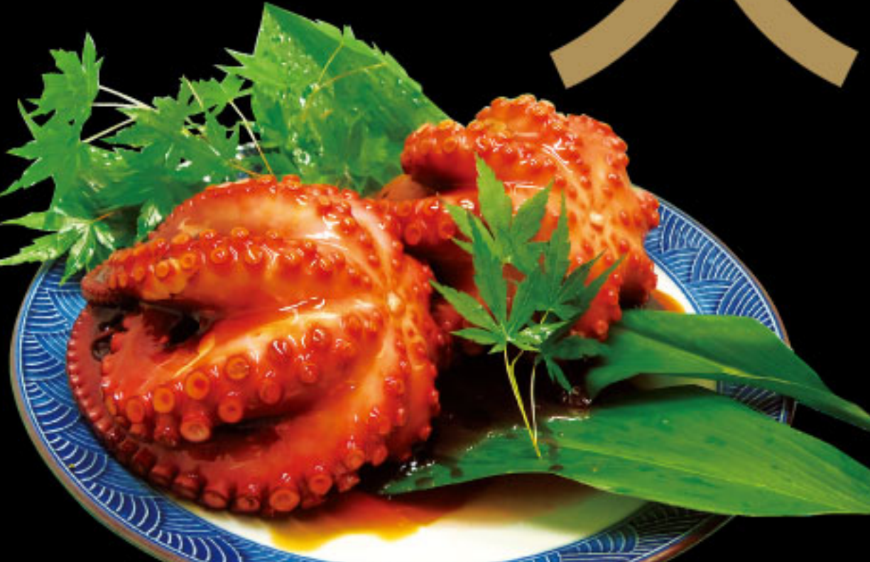
分厚いのに柔らかい! 名物たこ煮 萌水産 ●兵庫県 たこのやわか煮(100g)……1,080円