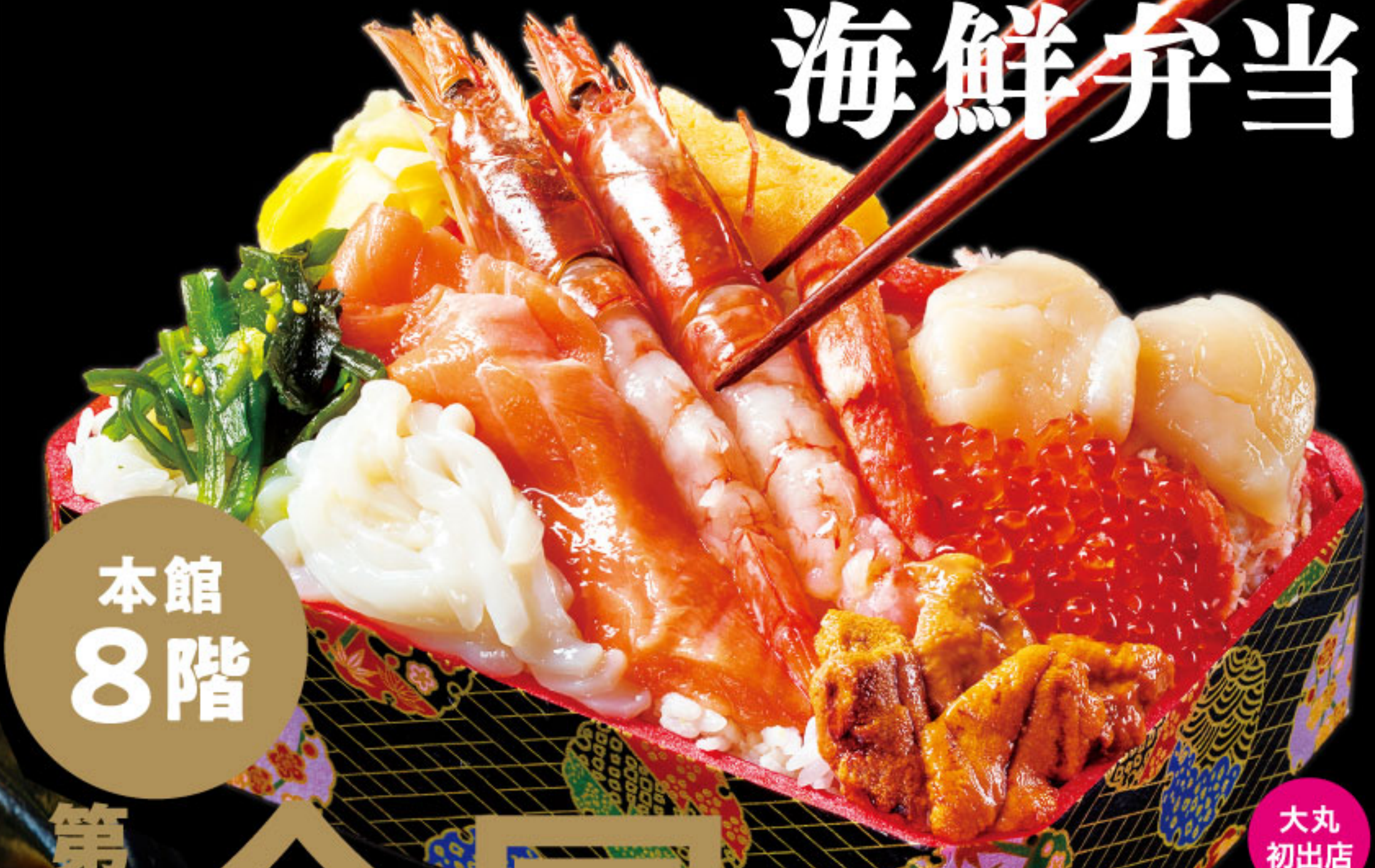
大丸初出店 第八太洋丸 ●実演 ●北海道 積丹弁当(1折) 2,376円