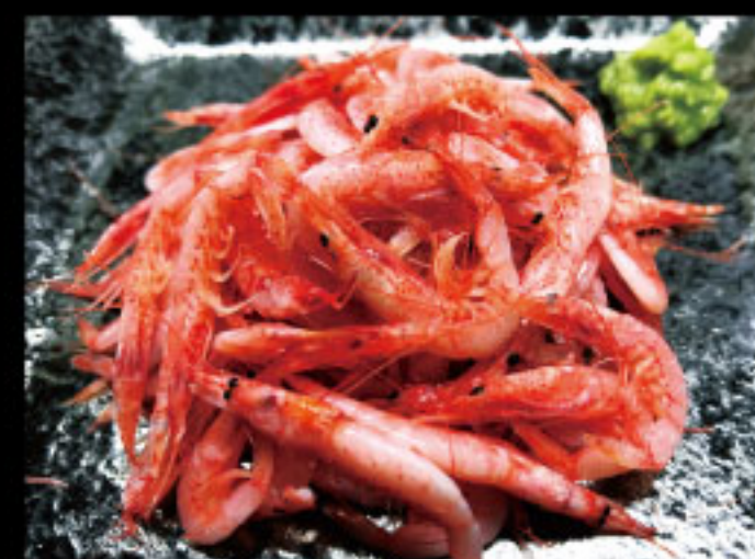
獲れたてをサッと茹でた静岡名物! えび金本店 ●静岡県 桜えび釜揚げ(70g入り) 1,080円