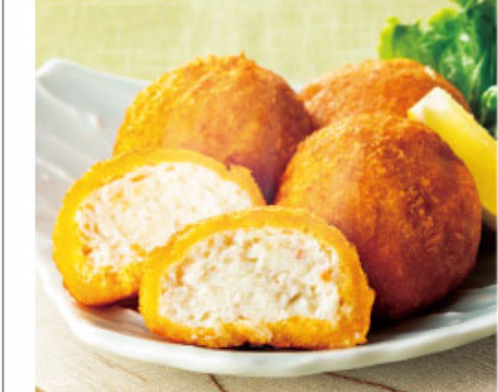
かんの出汁があふれ出る唯一無二のコロッケ! 徳なが ●佐賀県 かにだしコロッケ(1個)……378円