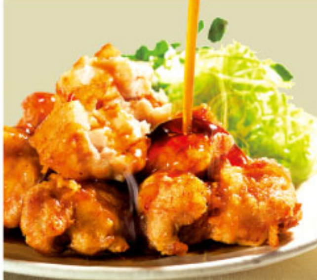
甘辛くて、ジューシー。ごはんがすすむおいしい。 チキン南蛮専門店 金の皿 ●宮崎県 チキン南蛮(100g)……486円

551 HORAI 待ち時間がわかる整理券配布 店頭でご購入ご案内整理券を発行いたします。スマートフォンをお持ちのお客様は二次元コードを読み取りいただきましたら待ち時間をリアルタイムでお知らせいたします。スマートフォンをお持ちでないお客様にも整理券発行時におおよその待ち時間をお知らせいたします。