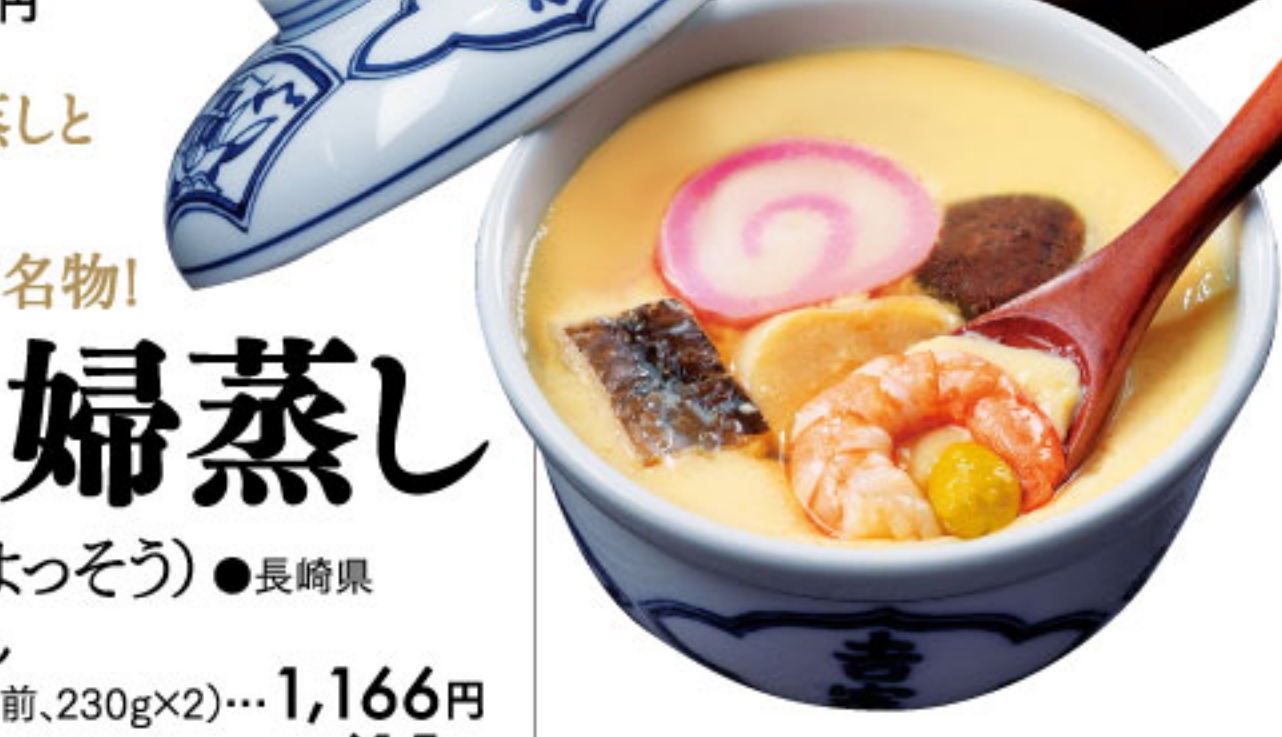
茶碗蒸しと蒸寿し 一対が名物! 夫婦蒸し 吉宗(よっそう) ●長崎県 茶碗蒸し(冷凍、2人前、230g×2)……1,166円 蒸寿し(冷凍220g)……615円

その他の出店 (北海道/釧路館)海鮮弁当(青森県/カネショウ)りんご餅(秋田県/亀谷食品加工場)山ぶどうジュース(福島県/松本養蜂総本場)ブナの森はちみつ(新潟県/海宝)珍珠(埼玉県/ベルジュレコレテ)フルーツゼリー(東京都/うまい豆や ほうさく)秘伝豆(静岡県/細川製茶)静岡茶(愛知県/英国紅茶専門店ボッシュ)英国紅茶(滋賀県/天平フーズ)キムチ(三重県/お茶の笠半)伊勢茶(大阪府/かみなり小僧)手羽先唐揚げ(大阪府/マルイフ食品)ふりかけ(大阪府/栗心堂)甘栗(大阪府/角美)豆腐お好み焼き(兵庫県/財木商店)いかなご釘煮(和歌山県/梅干職人きく)梅干(福岡県/九州緑茶)知覧茶(長崎県/つばき家本舗)五島うどん(長崎県/佐々木商店)ちりめん(鹿児島県/桜島や)地鶏炭火焼き(沖縄県/干草物産)干草