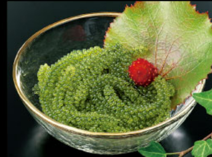
鮮度が高く風味もよい海ぶどう! もぎキム ●沖縄県 海ぶどう(80g)……1,395円