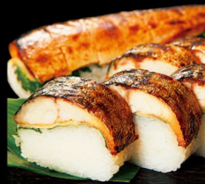
身は程よく脂ののって、しっとり肉厚! 若廣 ●福井県 焼き鯖すし(1本8貫)……1,188円