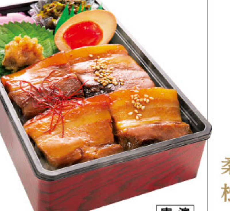
とろとろ角煮にとろーり半熟卵。 ダイニング萬来 ●鹿児島県 鹿児島黒豚角煮弁当(1折)……1,296円