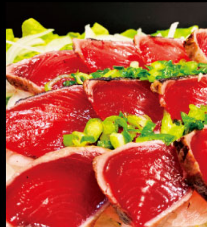
香ばしく濃厚な味わいの高知名物! ハマヤ ●高知県 薫焼き鰹のたたき(100g) 799円